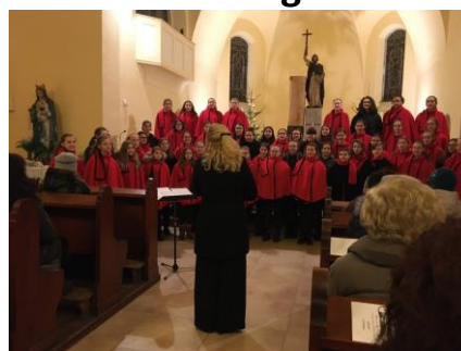
komorní sbor Severáčku