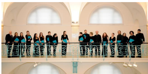
Pěvecký sbor Cum decore